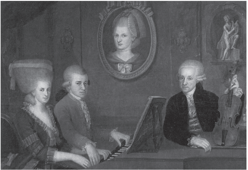
Wolfgang Amadeus Mozart mit Schwester »Nannerl« und Vater Leopold